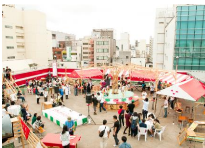
《ルーフトップ・メリーゴーランド》 2015