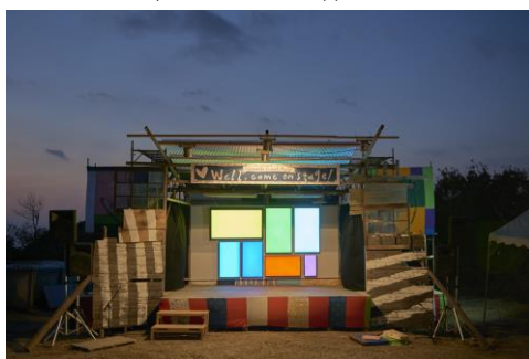
《Well, Come On Stage!》 2016