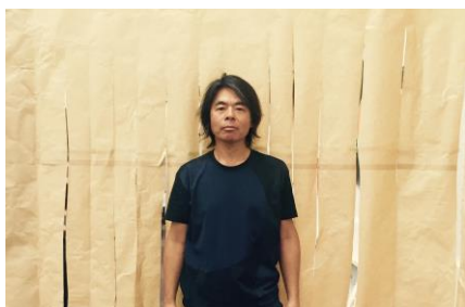
日比野克彦 (岐阜県美術館館長)