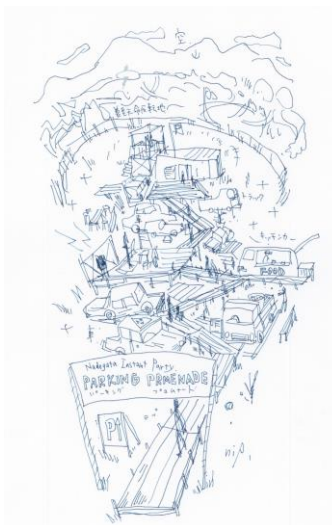
《パーキング・プロムナード イメージスケッチ》 2018 Ndegata Instant Party