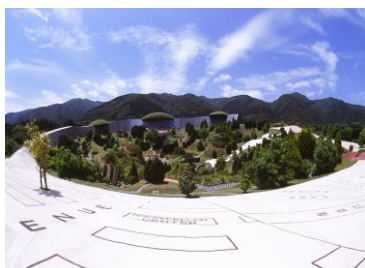
養老天命反転地・楕円形フィールド全景 © 1997 Estate of Madeline Gins. Reproduced with permission of the Estate of Madeline Gins.