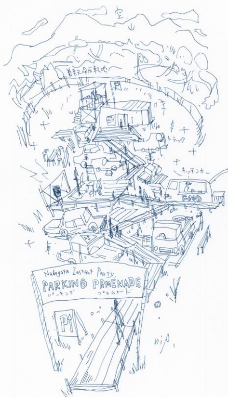
《パーキング・プロムナード イメージスケッチ》2018 Nadegata Instant Party