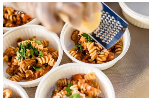
11/25には、地産地消・自家製にこだわる大垣市の人気店トリコローレが来店！（写真のメニューはイメージです）。

日 時：11月23日（金・祝） 14：00～16：00 会 場：養老公園 出 演：Nadegata Instant Party その他：事前申込み不要、無料